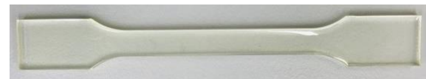
開発品配合エポキシ樹脂硬化物