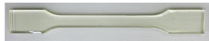
エポキシ樹脂硬化物